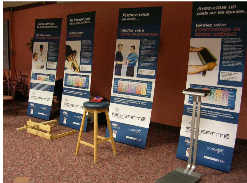
Quelques-unes des stations mobiles utilisées en entreprises par les kinésiolesgues de ISO-SANTÉ. Elles permettent d'évaluer plus de 100 personnes par jour. Ce qui permet d'effectuer des activités de sensibilisation efficaces, appréciées et à un coût abordable.

La kinésiolesgie étant un domaine récent, la décision de créer un ordre professionnel a été prise récemment en Ontario. Au Québec, ces derniers sont regroupés sous forme de Fédération.